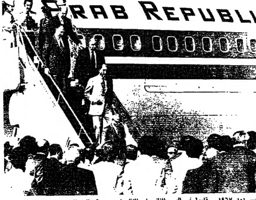
الرئيس السادات لدى نزوله من الطائرة في مطار دمشق